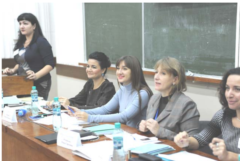
Президиум межрегиональной научной конференции. 2017 г.

Опубликованы 52 научные работы, в том числе 3 монографии, 7 учебных пособия, 2 статьи в журналах ВАК, 3 в РИНЦ.